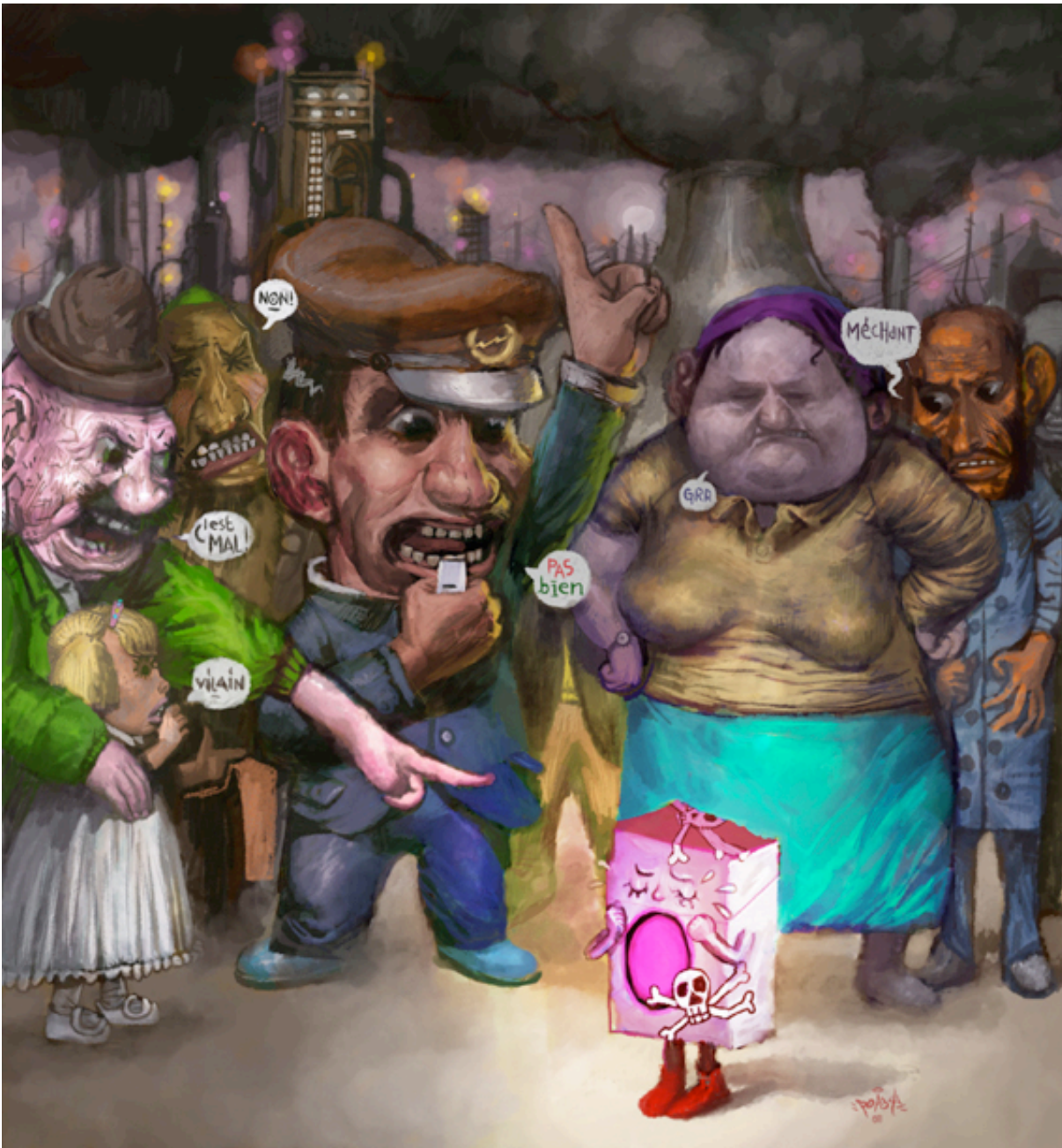
Illustration : Popay